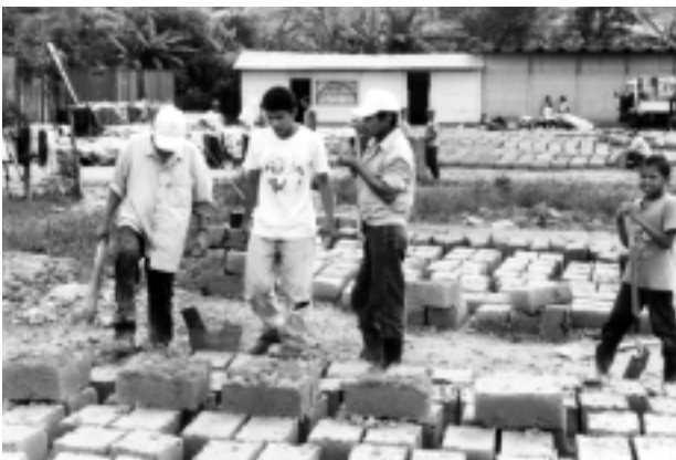
Für den Bau der ökologischen Modellsiedlung in Wiwili werden Lehmziegel verwendet

Wiwili-Verein, PGA Karlsruhe, BLZ 66010075, Kto-Nr 229871756, oder Stadt Freiburg, Sparkasse Freiburg, BLZ 68050101, KtoNr 10020018, Stichwort 'Vauban-Wiwili'