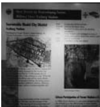
Vauban auf der UN-Weltsiedlungskonferenz Habitat II.