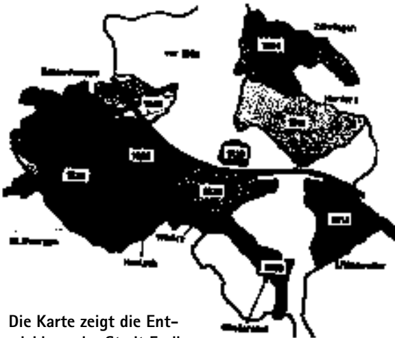
Die Karte zeigt die Entwicklung der Stadt Freiburg bis zur Eingemeindung von St. Georgen.