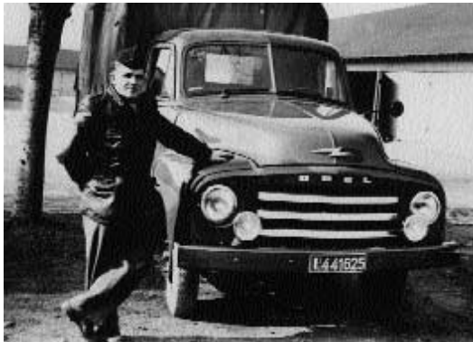
Impressionen aus der Vauban-Kaserne Anfang der 50er Jahre.

Im Herbst 1945 wurden die ehemals Deportierten in ihre Heimatländer zurückgeschickt, und es zogen französische Truppen in die Kasernen ein, für die die Anlage erweitert wurde. Am Ortsrand von Merzhausen wurde ein flaches, weißes Casino für Offiziere gebaut, das heute Asylunterkunft ist, und auf dem Gelände jenseits der Heinrich-Mann-Straße entstanden weitere Mannschaftsgebäude, die sich im Baustil eng an die