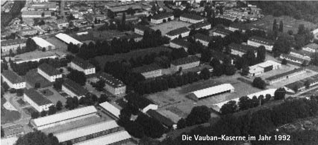
Die Vauban-Kaserne im Jahr 1992

Der dritte Teil unserer Serie zur Vauban-Geschichte handelt von den ersten zivilen Nutzungen im Quartie.