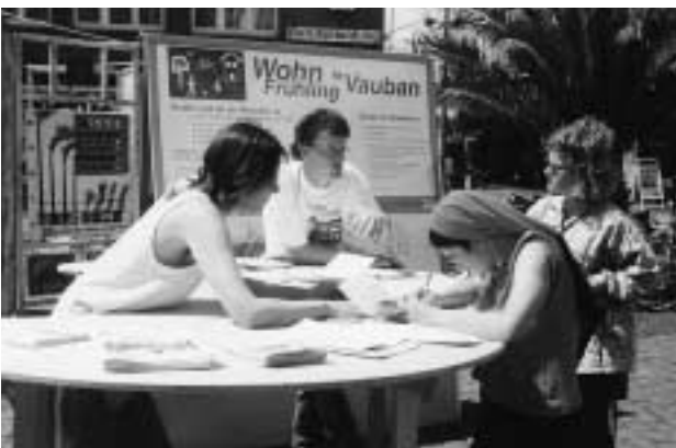
Wohnfrühling-Infostand des Forums anno 1996

Wichtig war aber vor allem, dass das Forum als Gesprächspartner akzeptiert wurde, einen Sitz in der gemeinderätlichen Arbeitsgruppe erhielt, und nun auch Geld floss. Durch Unterstützung des neu gegründeten Kuratoriums Vauban unter Vorsitz des Baubürgermeisters bekam das Forum 40.000 DM jährlich und konnte nun ein Büro einrichten. Ende November