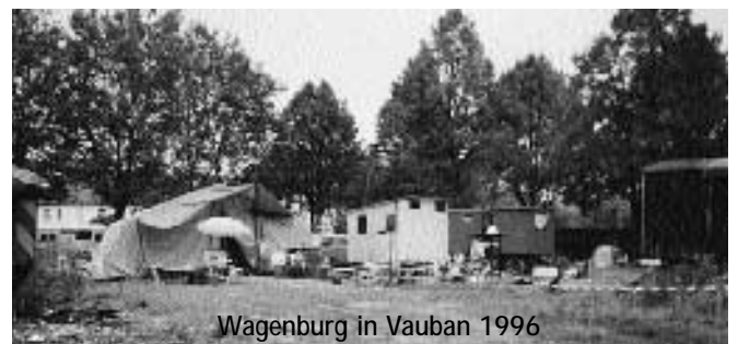
Wagenburg in Vauban 1996

für Menschen mit unterschiedlichen Lebensentwürfen, die dort für einen Moment ausgelebt werden konnten." Deshalb (oder trotzdem?) gab es erstaunlich wenig Konflikte untereinander, was auch Günter Zinnkann, der in dieser Zeit als Polizist auf dem Gelände tätig war, bestätigt. Es habe kaum kriminelle Vorkommnisse gegeben, am ehesten Schlägereien zwischen alkoholisierten Gruppen, und deshalb auch kein Anlass für Razzien. Den jetzigen Pensionär, dessen Text- und Fotodokumentation ich wertvolle Informationen verdanke, trifft man heute