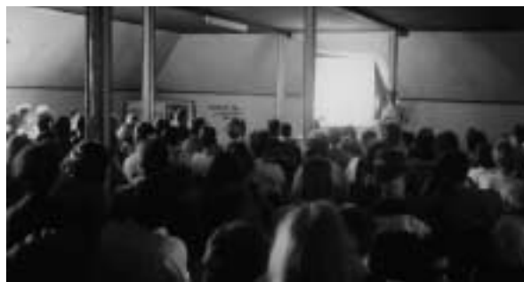
Die erste Baugruppenbörse im Dachgeschoss von Haus 07

Den städtebaulichen Wettbewerb, den die Stadt Freiburg bundesweit ausgeschrieben hatte, gewann das Büro Kohlhoff aus Stuttgart. Darin wurde u.a. die Ost-West-Ausrichtung der meisten Häuser fest-