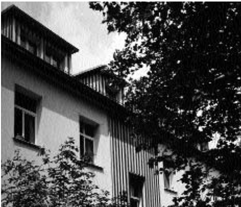
Renoviertes Haus der Siedlungsinitiative SUSI von außen ...